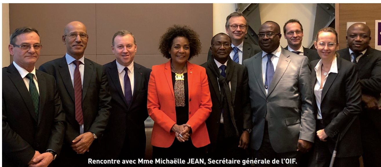
Rencontre avec Mme Michaëlle JEAN, Secrétaire générale de l'OIF.